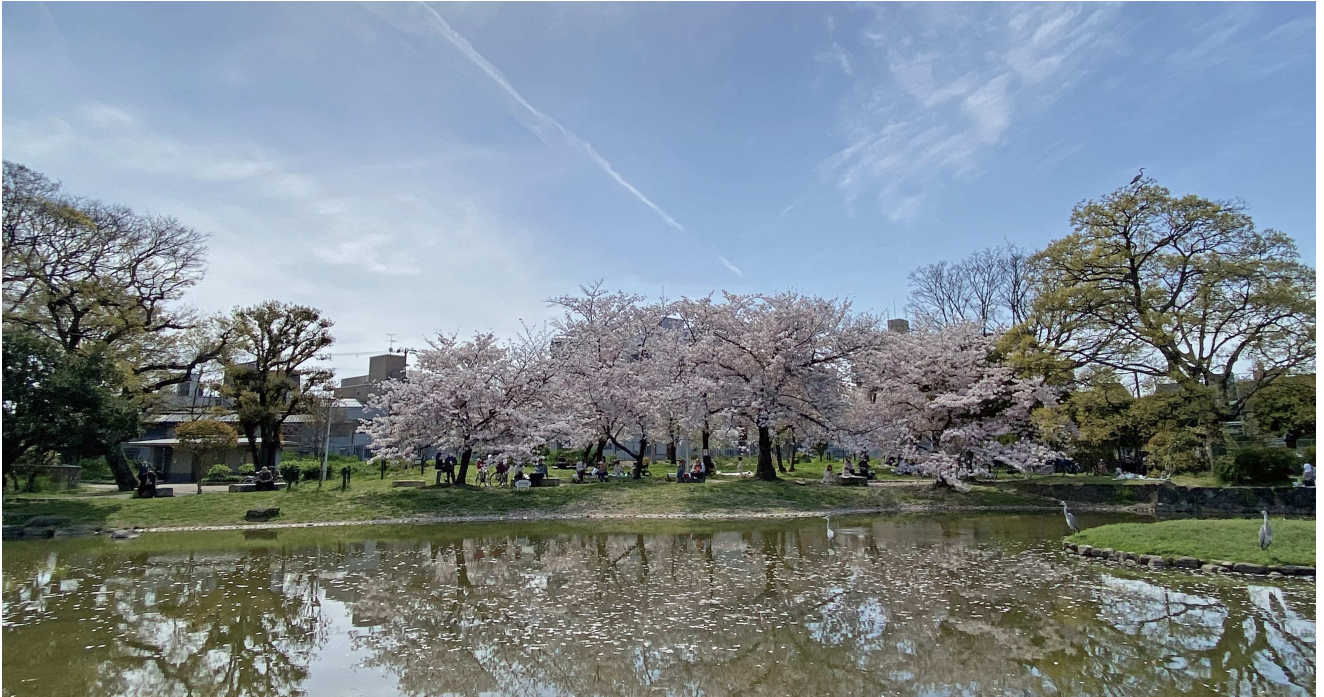
響き合う桜と水面 みなも (大阪市住之江区、住吉公園)

二〇二四年元日、石川県能登地方を震源とする地震が発生し、たくさんの方が被災し、建物の倒壊や火災、道路の寸断など、多大な被害をもたらしました。連日テレビで報道される状況を見ると、被災された方々が想像を絶するほど、苦しく辛い思いをされているのだと心が痛みます。