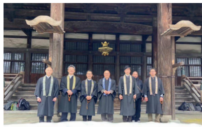
① 願慶寺にて ② 専照寺にて