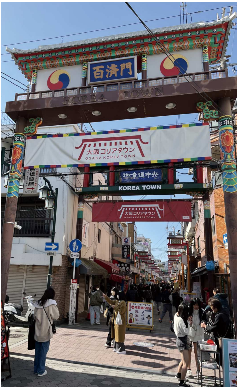
連日賑わう大阪コリアタウン

JR鶴橋駅の南東1キロに、年間200万人が訪れる一大観光地コリアタウンがあります。キムチやチジミ、豚肉などの韓国食材や民族衣装、韓流ドラマ・Kポップスターのグッズ等を扱う約150店が軒を連ねています。最近は特に韓国コスメの専門店や食べ歩きできる店も増え、多くの若者らで賑わっています。